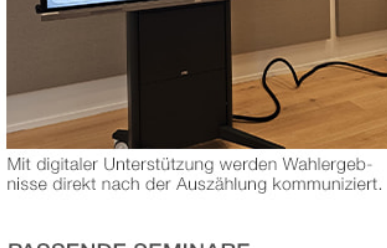
Mit digitaler Unterstützung werden Wahlergebnisse direkt nach der Auszählung kommuniziert.